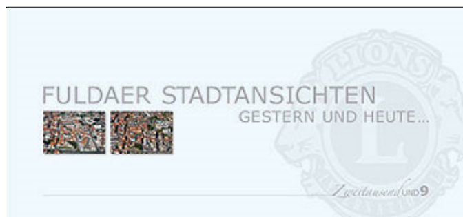
Der Kalender "Fuldaer Stadtansichten - Gestern und heute" ...

Der Kalender mit einem Format von 69 mal 32 Zentimetern kostet 15 Euro und ist ab Mitte nächster Woche in der VR-Genossenschaftsbank, im ÜWAG-Kundenzentrum, im Mediamarkt, in der Galeria Kaufhof, beim Modehaus Köhler sowie in der Adler-Apotheke in Petersberg erhältlich. Auch im Onlineshop unter http://www.lions-club-fulda-bonifatius.de kann er erworben werden. (j)d+++