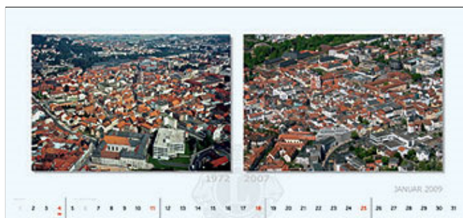
... ist ab Mitte nächster Woche für 15 Euro erhältlich.